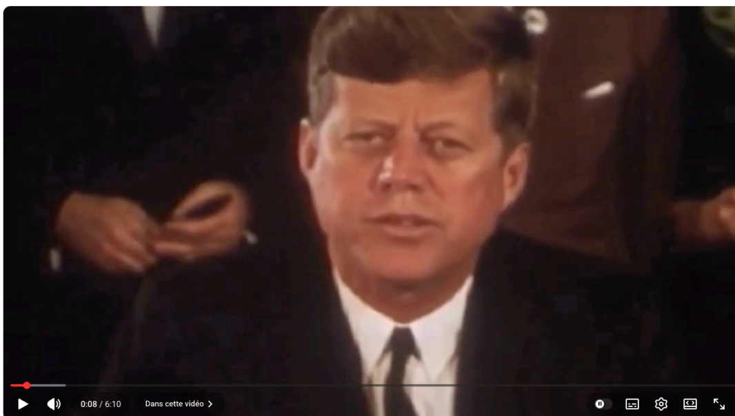
Atelier détournement - Lycée Albert Triboulet 2026

Autres exemples de productions : Playlist