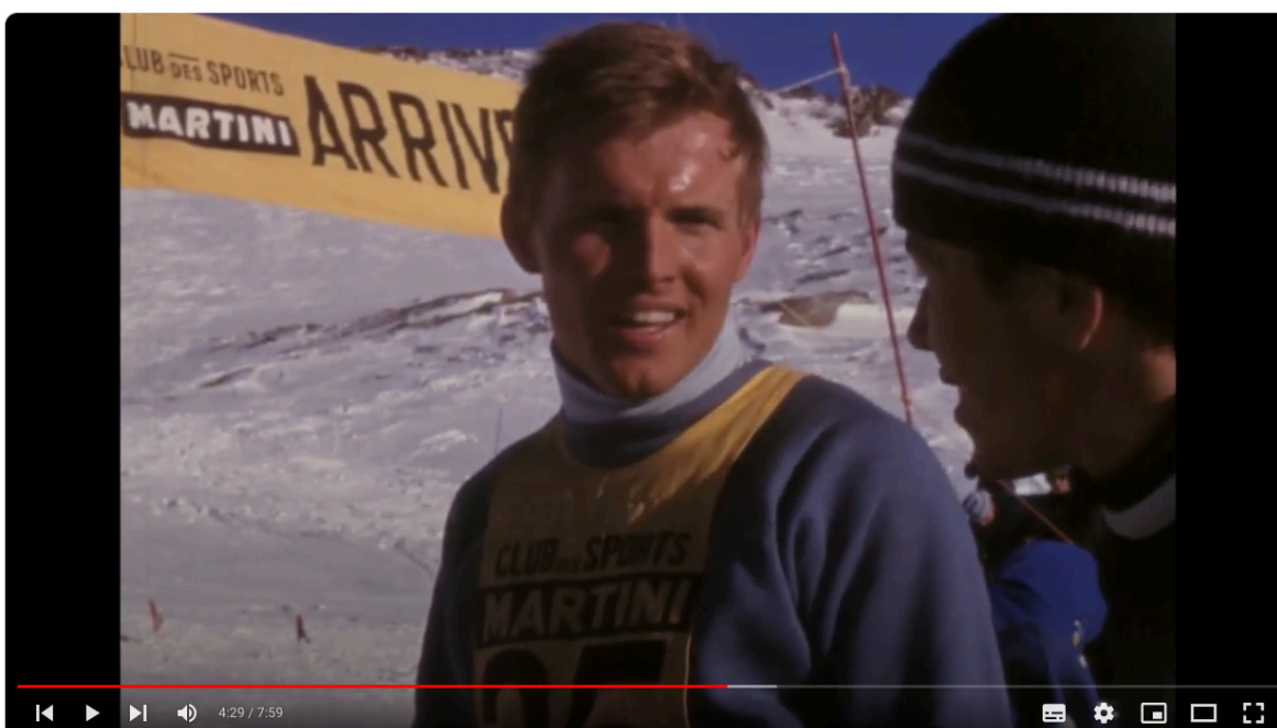
Votre version de l'histoire : Les J.O de Grenoble - Médiathèque de Jean d'Ormesson

Autres exemples de productions : Playlist